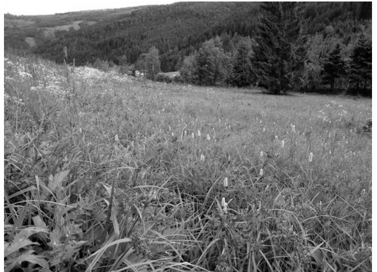
Abb. 4. Flugplatz von Euphyia unangulata in Fegendorf bei Thomatal: Waldmantel (im Hintergrund) am Rand einer Niedermoorstreuweise (, 6.06.2014).