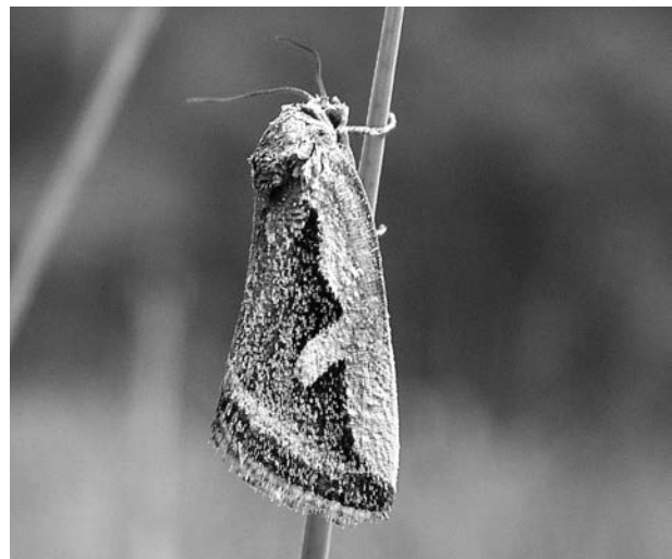
Abb. 5. Die Riedeule ( Deltote uncula ) wird erstmals aus dem Lungau gemeldet.