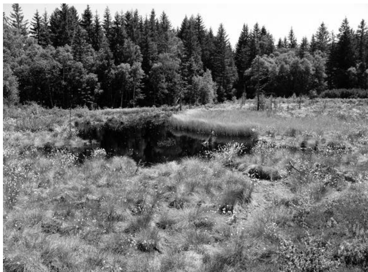
Abb. 3. Flugplatz von Crambus alienellus im Saumoos bei St. Michael: Offene, teils degradierte Hochmoorbereiche.