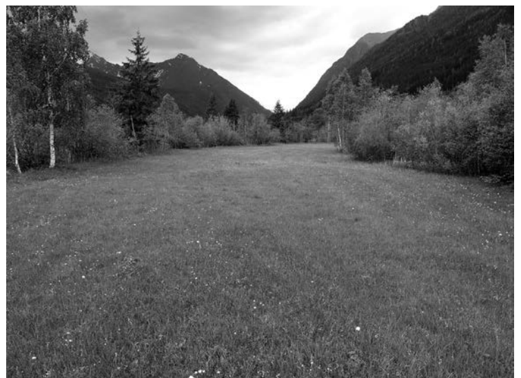
Abb. 6. Flugplatz von Deltote uncula im Lonka-Tal bei Schwaig: Magere Niedermoorwiese.