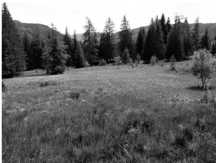
Abb. 2. Flugplatz von Glyphipterix haworthana am Fanningberg nordwestlich Steindorf: Extensiv beweidete, nährstoffarme Niedermoorwiesenbereiche.

Diese kleine, aber prachtvoll gefärbte Moorart nutzt Wollgräser ( Eriophorum spp.) als Raupen-Futterpflanzen