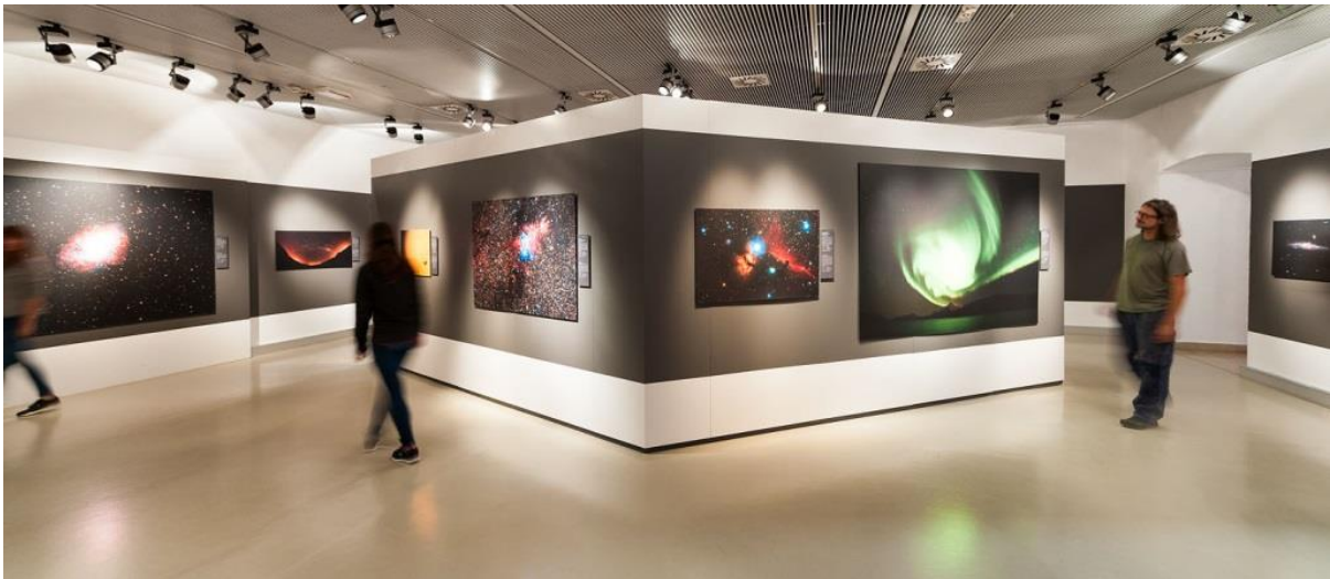
Blick in die Ausstellung „Himmelsbilder“