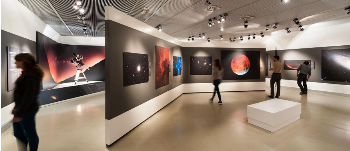
Blick in die Ausstellung „Himmelsbilder“

Die Bilder dürfen für Berichte über die Sonderausstellung im Haus der Natur und unter Angabe des Copyrights honorarfrei verwendet werden.