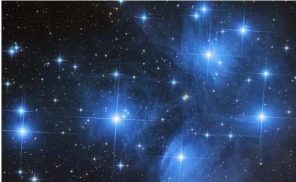
Die Plejaden liegen etwa 400 Lichtjahre von der Erde entfernt im Sternbild Stier.

Der Astrograph H8 der Firma ASA