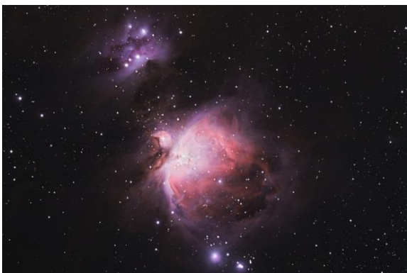
M42 – der Orionnebel ist eines der aktivsten Sternentstehungsgebiete in Erdnähe.