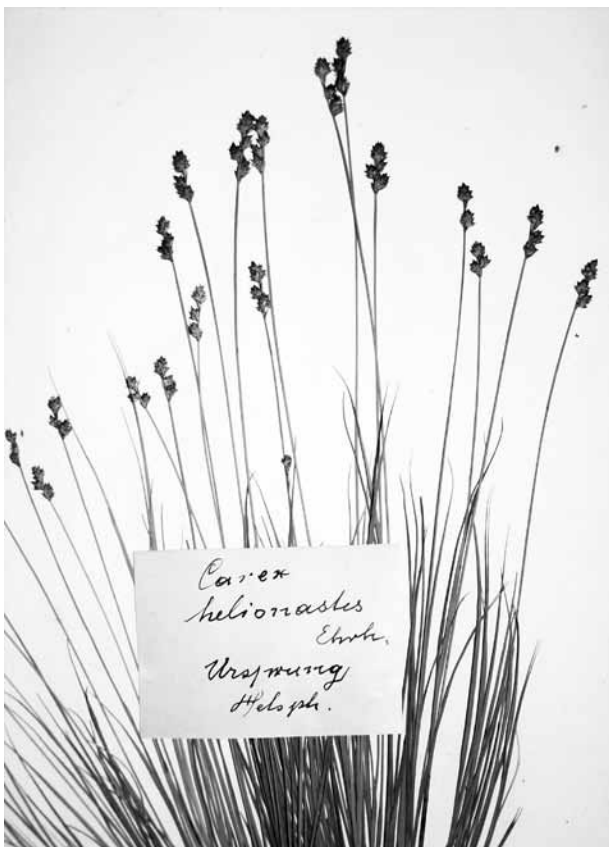
Abb. 1: Herbarbeleg mit dem Etikettentext: „ Carex heleonastes Ehrh., Ursprung Heloph.“. Diese auch literarisch von Ursprung belegte, moortypische Segge ist heute im Land Salzburg ausgestorben.