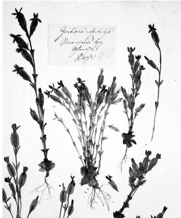
Abb. 6: Herbarbeleg mit dem Etikettentext: „ Gentiana utriculosa , Moorwiesen bei Glanegg, P. Jac. Gries“. Gentiana utriculosa ist heute an diesem Fundort längst ausgestorben.