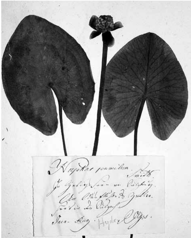
Abb. 3: Herbarbeleg mit dem Etikettentext: „ Nuphar pumilum , in Gebirgsseen um Salzburg, am Abflusse des Zellersees in die Salzach, Jun.-Aug., P. J. Gries“. Nuphar pumila ist heute am Zellersee ausgestorben, die Pflanze existiert in Salzburg rezent nur mehr an einer Stelle im Lungau.