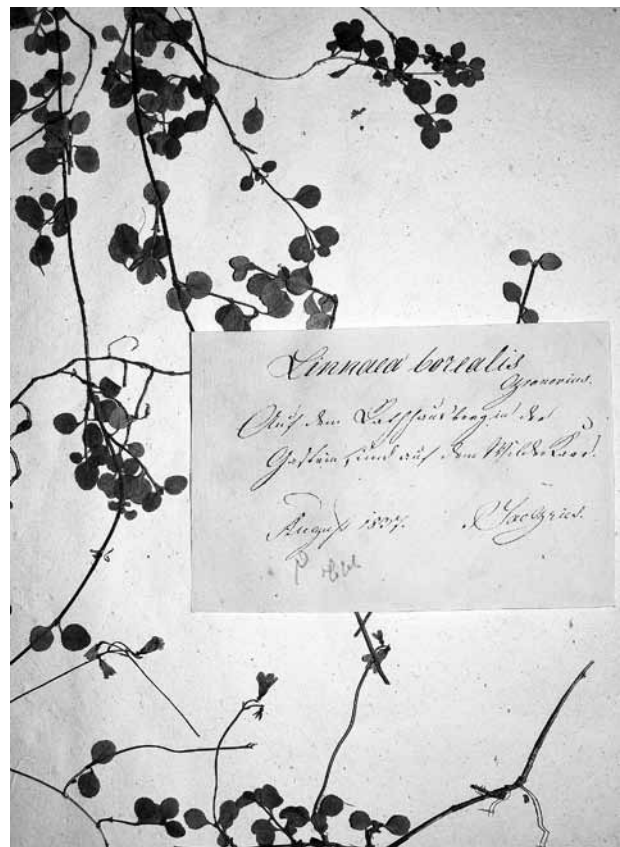
Abb. 2: Herbarbeleg mit dem Etikettentext: „ Linnaea borealis , auf dem Radhausberg in der Gastein und auf dem Wildenkar, August 1827, P. Jac. Gries“. Linnaea borealis ist am Radhausberg heute verschollen, eine Lokalität „Wildenkar“ wird in der botanischen Literatur über Salzburg nicht genannt.