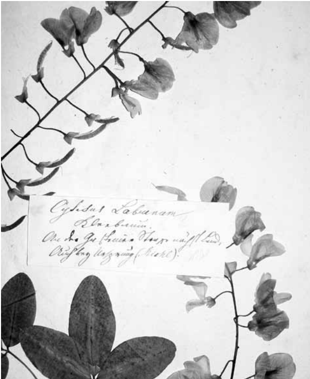
Abb. 5: Herbarbeleg mit dem Etikettentext: „ Cytisus laburnum , Kleebaum, an der Gasteiner Strasse nächst Lend, auch bey Ursprung (Michl).“ [Schrift von Jak. Gries]. Obwohl ohne Sammeldatum, so dürfte dies doch ein erster gesicherter Nachweis einer frühzeitigen Verwilderung von Laburnum anagyroides im Land Salzburg sein.